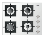
VETRO BIANCO LUCIDO FCH 604 G WH