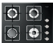
VETRO NERO LUCIDO FCH 604 G BK

Adattatore in ghisa per Wok Riduzione in ghisa per pentole di piccolo diametro Cavo di collegamento con spina