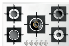
VETRO BIANCO LUCIDO FCH 775 G WK WH