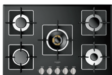
VETRO NERO LUCIDO FCH 775 G WK BK

Adattatore in ghisa per Wok Riduzione in ghisa per pentole di piccolo diametro Cavo di collegamento con spina