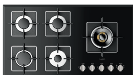
VETRO NERO LUCIDO FCH 905 G DWK BK

Adattatore in ghisa per Wok Riduzione in ghisa per pentole di piccolo diametro Cavo di collegamento con spina