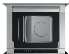
VETRO NERO LUCIDO FVSD 150 TC BK