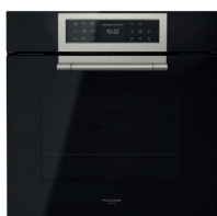
VETRO NERO OSSIDIANA FCLO 6215 TEM BK

Sonda termica per la rilevazione della temperatura nei cibi 1 vassoio in vetro temprato 1 vassoio smaltato 2 griglie metalliche piane Set guide telescopiche ad estrazione totale Cavo di collegamento con spina