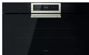
VETRO NERO OSSIDIANA FCLO 9615 TEM 2F BK

Sonda per la misurazione della temperatura nei cibi Girarrosto con spiedo 2 vassoi smaltati 1 griglia metallica piana Cavo di collegamento con spina