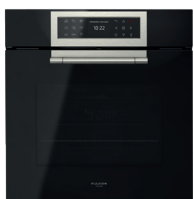
VETRO NERO OSSIDIANA FCLPO 6215 P TEM BK

Sonda per la rilevazione della temperatura nei cibi 1 vassoio in vetro 2 guide telescopiche ad estrazione totale 1 griglia tonda in acciaio 1 paletta per pizza 1 accessorio in refrattario 1 griglia metallica piana Cavo di collegamento e spina