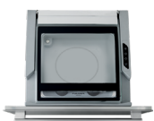
ACCIAIO INOX FVSD 2900 TC EAN 8019801019496

L'estetica del cassetto sottovuoto è pannellabile, a richiesta è disponibile kit pannello inox comprensivo di maniglia (Cod. FT 29 X)